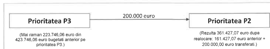
SCHEMA TRANSFERULUI SOLICITAT