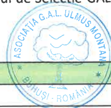
Tabel cu componenta Comitetului de Selectie, membri supleanti: